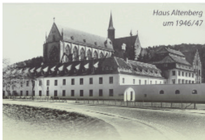
Haus Altenberg um 1946/47

Nutzen Sie zur individuellen Planung am besten die Fahrplanauskunft der Kraftverkehr Wupper Sieg AG ( www.wupsi.de ).