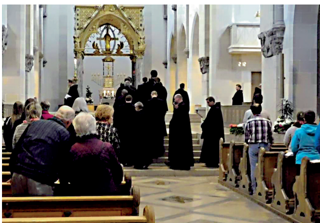
Einzug der Mönche in die Basilika zum Gottesdienst.

Insgesamt durften wir wieder einmal ein schönes und erfolgreiches Jahrestreffen erleben! ROBERT SEIFERT