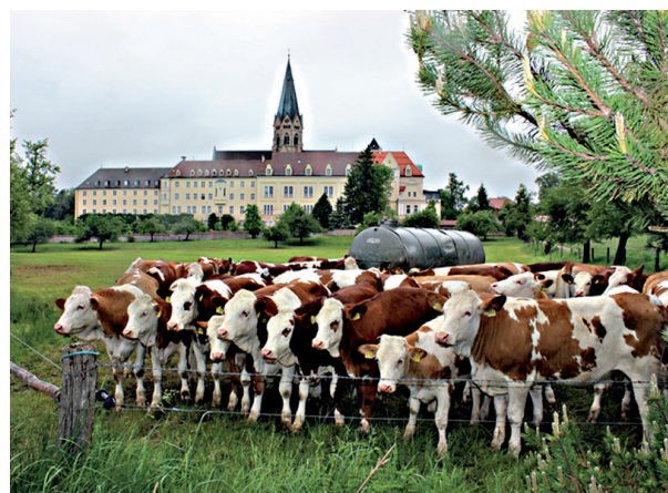
Das sind nicht die Teilnehmerinnen und Teilnehmer am Jahrestreffen, sondern die in St. Ottilien gepflegten Rindviecher.